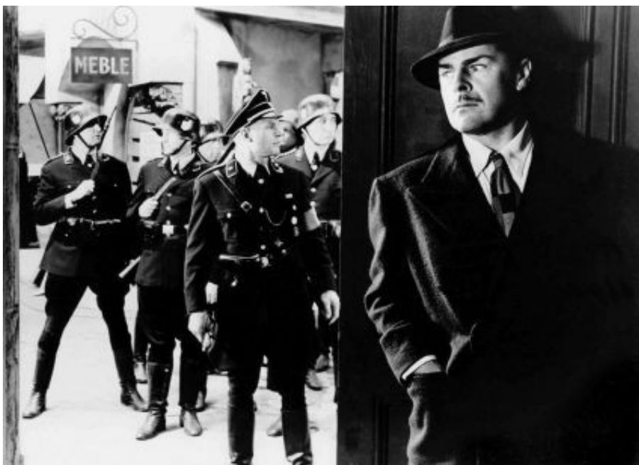
Brian Donlevy in „Hangmen Also Die“

im amerikanischen Exil lebenden deutschen Künstlern sehenswert: Bertolt Brecht und Fritz Lang.